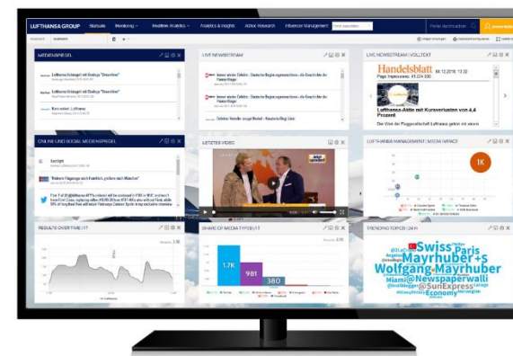
Kundenbeispiel: Portal (Lufthansa)