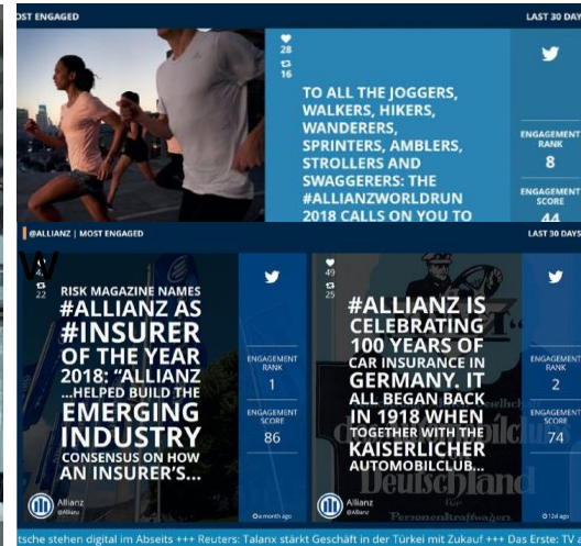
Kundenbeispiele: Videowall (Lufthansa) und Newsscreen (Allianz)