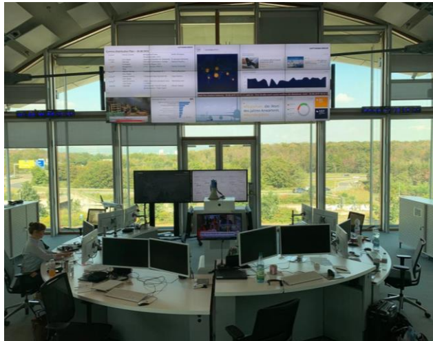
Kundenbeispiele: Videowall (Lufthansa) und Newsscreen (Allianz)