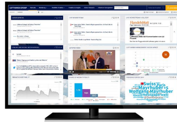
Kundenbeispiel: Portal (Lufthansa)