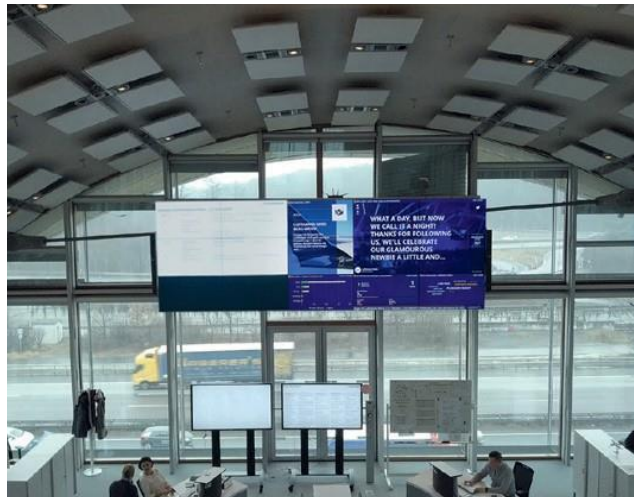
客户案例：视频墙（汉莎航空）和新闻屏幕（安联）