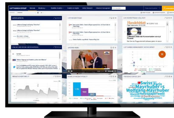
客户案例：客户专用网站（汉莎航空）